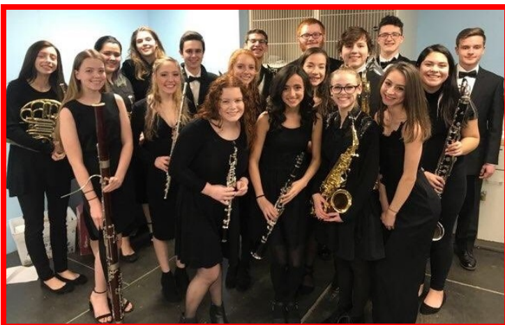
Representación de Patchogue-Medford High School en el Concierto de Banda de Honores de Mid Island.