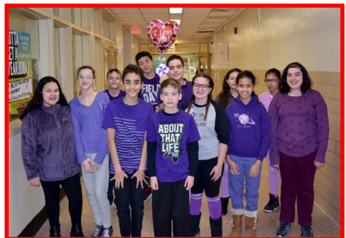
Los estudiantes de Saxton vestían morado para "PS I Love You Day" con el fin de difundir el amor, disminuir la intimidación y promover la conciencia de la salud mental.