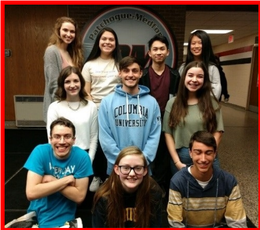
Los diez mejores estudiantes de la clase del 2018