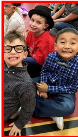
Estudiantes de kínder de Canaan en su 100 ° celebración escolar (a la izquierda). En la foto a la derecha, los estudiantes de Bay fueron reconocidos por mostrar respeto en una ceremonia de alfombra roja.