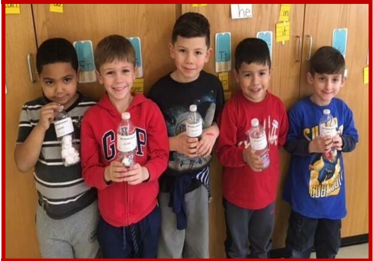
Los estudiantes de la escuela River río celebrando la finalización de una unidad de estaciones y del tiempo y muestran qué temporada es su favorita.