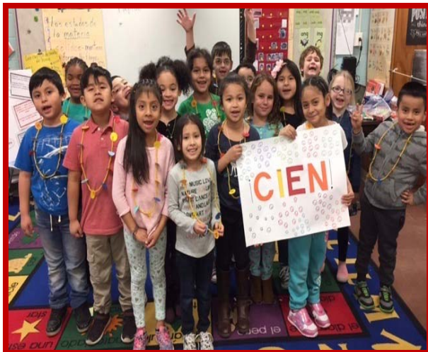
Los estudiantes de la escuela Bay y Tremont celebrando el 100o día de la escuela