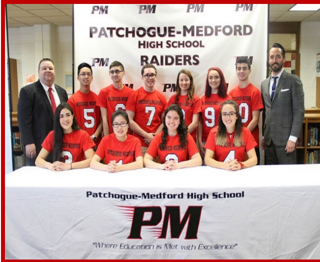
Los diez mejores estudiantes de la clase del 2017