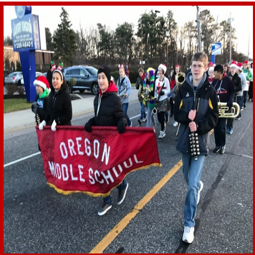
Estudiantes de la escuela secundaria de Oregon marchando en el desfile de Medford

Voto del Distrito Escolar Martes 16 de Mayo del 2017 7 a.m. - 9 p.m. AUDIENCIA PARA EL PRESUPUESTO: JUEVES 4 DE MAYO DEL 2017 a las 7:00 p.m. en la Escuela Intermedia South Ocean